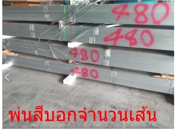
พ่นสีบอกจำนวนเส้น