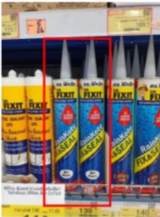
ในชั้น 10 หลอด

2. 8852282103281 เรนโค้ท ฟิกซ์แอนด์ซีล วัสดุซ่อมรอยแตกร้าว 310มล. สีดำ Dr.Fix 19.00 22.00 3.00