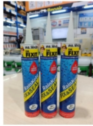
เกิน แยกไว้ 3 หลอด