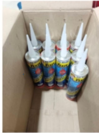
Top Stock 9 หลอด