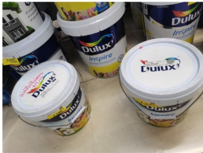
ICI 10 ลิตร 2 ถัง